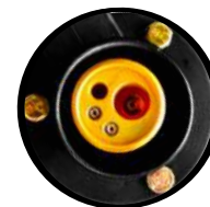
Conexión MIG tipo europeo industrial