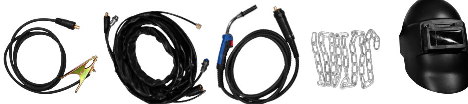
MASA + ANTORCHA MIG + CABLE CONECTOR + MANGUERA + CADENA + CARETA