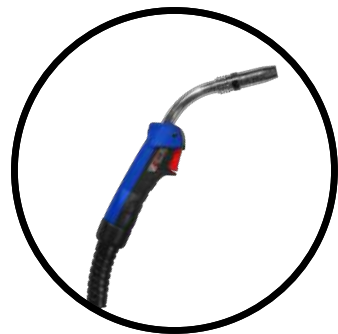
Antorcha MIG Binzel tipo industrial