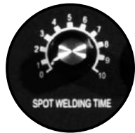
Función de soldadura MIG por puntos