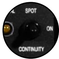
Función de soldadura MIG por puntos