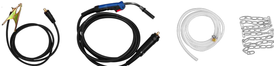
MASA + ANTORCHA MIG + MANGUERA + CADENA