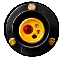
Conexión MIG tipo europeo industrial