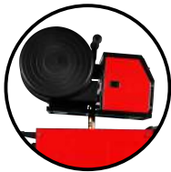
Alimentador externo de trabajo pesado