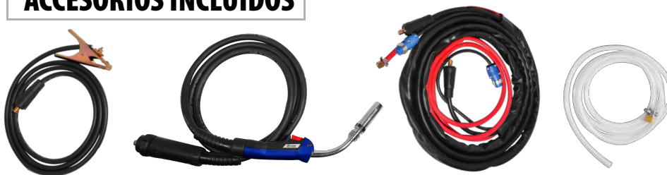
MASA + ANTORCHA MIG + CABLE CONECTOR + MANGUERA