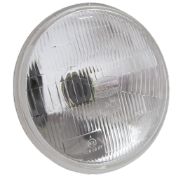
▲ 321-01-6014 Lámpara óptica redonda 7" con reflector de metal.

Faro principal para international workstar sin unidad 7" con cables.