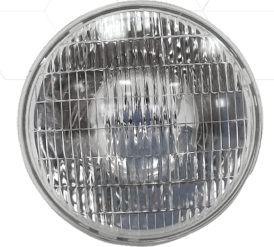
▲ 234-H6024 Unidad sellada halógena 12V H6024 DOT 65/40W redonda 7" 3C.

Lleva la unidad con la óptica que desees