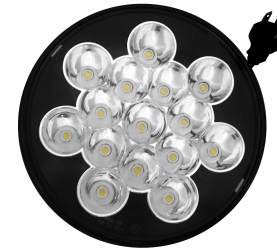
▲ 321-04-6014 Lámpara óptica redonda 7" 15 LED 2500 LM alto/bajo con cables 9-32V.