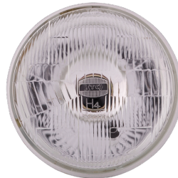
▲ 321-02-6014 Lámpara óptica redonda 7" con bombillo auxiliar, reflector de metal.