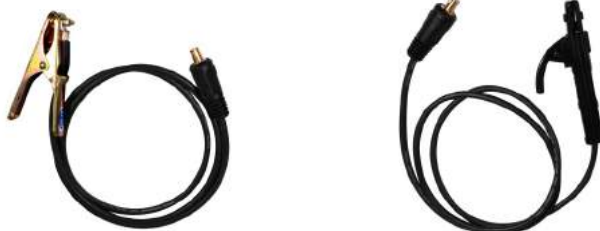
MASA + PORTAELECTRODO

Escanea el código QR para descargar el manual de usuario del equipo.