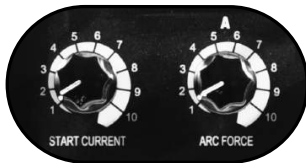
Perillas para control de Hot start y Arc Force