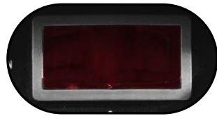
Display digital grande