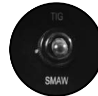
Selector de proceso electrodo / Lift TIG