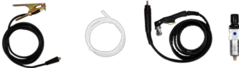
MASA + MANGUERA + ANTORCHA PLASMA + FILTRO REGULADOR