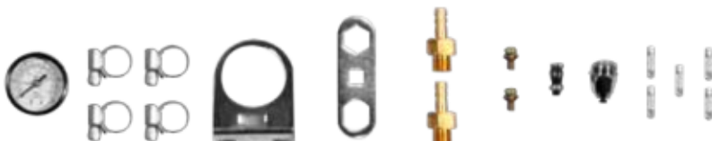
MANOMETRO + ABRAZADERAS + SOPORTE + LLAVE + NIPLE + BOQUILLA + ELECTRODO + FUSIBLE