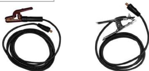
PORTAELECTRODO + MASA

Escanea el código QR para descargar el manual de usuario del equipo.