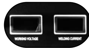
Pantallas de visualización LED de voltaje y amperaje