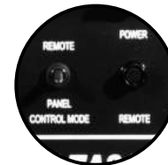
Panel para control remoto del equipo