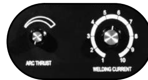
Perillas para control de fuerza de arco y de corriente