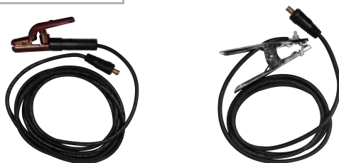
PORTAELECTRODO + MASA

Escanea el código QR para descargar el manual de usuario del equipo.