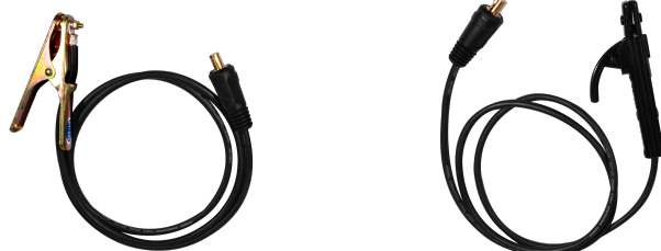
MASA + PORTAELECTRODO

Escanea el código QR para descargar el manual