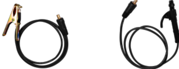
MASA + PORTAELECTRODO

Escanea el código QR para descargar el manual