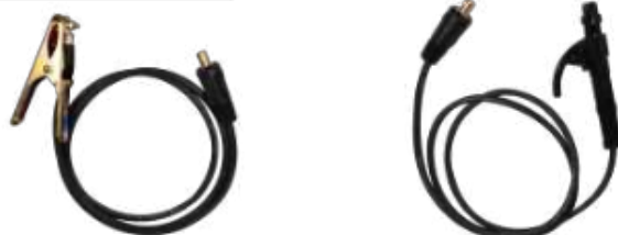
MASA + PORTAELECTRODO

Escanea el código QR para descargar el manual de usuario del equipo.