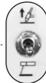
Selector de proceso electrodo / Lift TIG