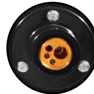
Conexión MIG tipo europeo industrial