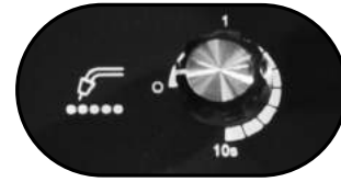
Función de soldadura