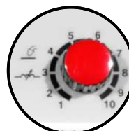
Control de inductancia