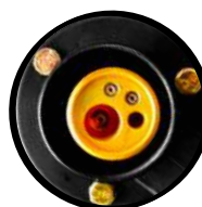
Conexión MIG tipo europeo industrial