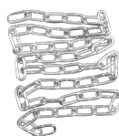
MASA + MANGUERA + ANTORCHA MIG + CADENA