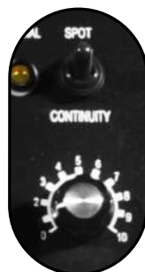
Función de soldadura MIG por puntos