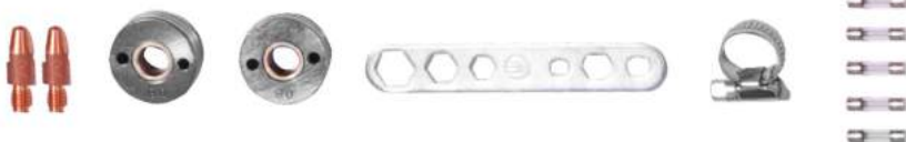
PUNTA CONTACTO + RODILLOS + LLAVE + ABRAZADERAS + FUSIBLES