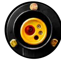
Conexión MIG tipo europeo industrial