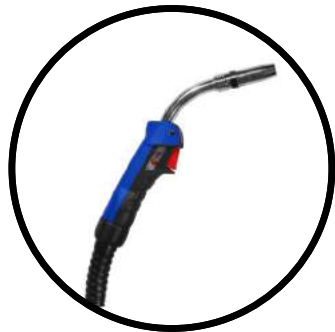
Antorcha MIG Binzel tipo industrial