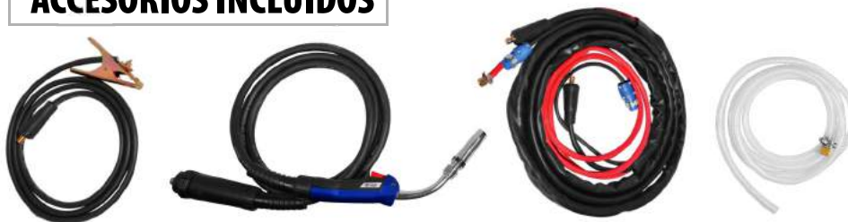
MASA + ANTORCHA MIG + CABLE CONECTOR + MANGUERA