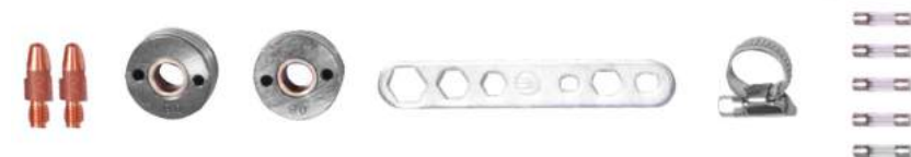
PUNTA CONTACTO + RODILLOS + LLAVE + ABRAZADERAS + FUSIBLES