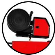
Alimentador externo de trabajo pesado