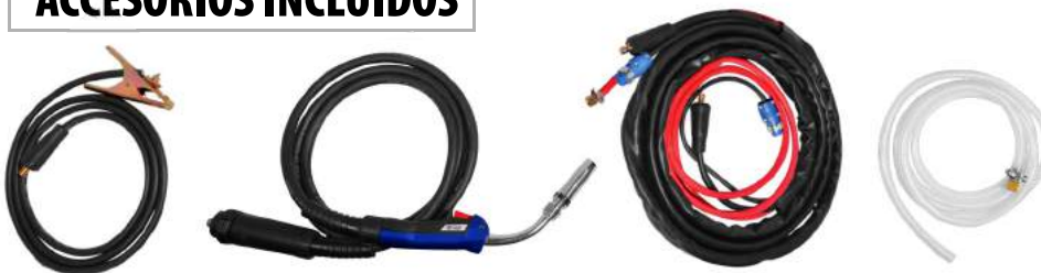
MASA + ANTORCHA MIG + CABLE CONECTOR + MANGUERA