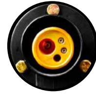
Conexión MIG tipo europeo industrial