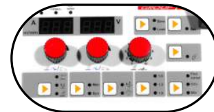
Función programación de parámetros de soldadura