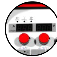
Panel digital de fácil manejo