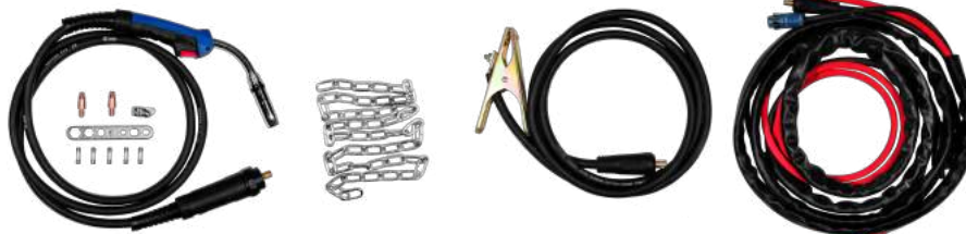
PUNTACONTACTO + TOBERA + DIFUSOR + MASA + ANTORCHA MIG

Escanea el código QR para descargar el manual