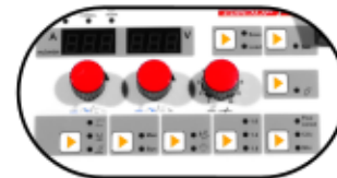
Función programación de parámetros de soldadura