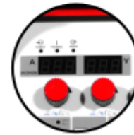
Panel digital de fácil manejo