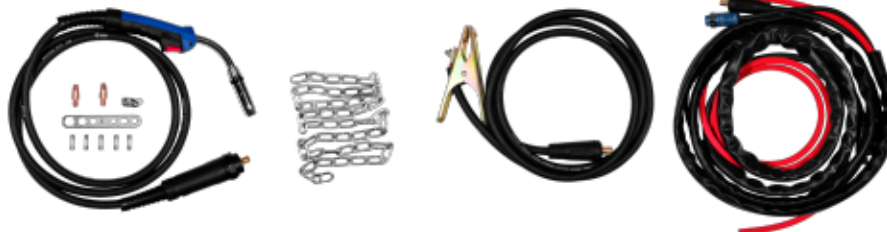
ANTORCHA MIG + CONSUMIBLES + CADENA + MASA + CABLE CONECTOR ALIMENTADOR-FUENTE + MANGUERA

Escanea el código QR para descargar el manual