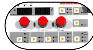
Función programación de parámetros de soldadura