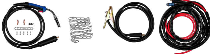
ANTORCHA MIG + CONSUMIBLES + CADENA + MASA + CABLE CONECTOR ALIMENTADOR-FUENTE + MANGUERA

Escanea el código QR para ver más información en nuestro canal corporativo.