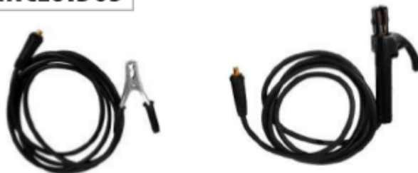
MASA + PORTAELECTRODO

Escanea el código QR para descargar el manual de usuario del equipo.