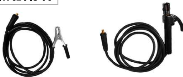
MASA + PORTAELECTRODO

Escanea el código QR para descargar el manual de usuario del equipo.