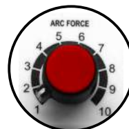
Perilla para control de Arc Force