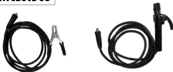
MASA + PORTAELECTRODO

Escanea el código QR para descargar el manual