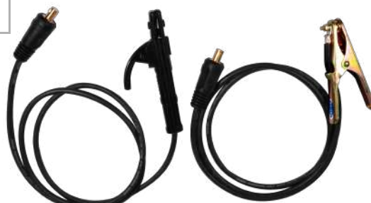
MASA + PORTAELECTRODO

Escanea el código QR para ver video en nuestro canal corporativo.