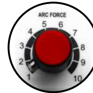
Perilla para control de Arc Force