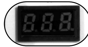
Display digital grande