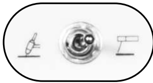
Selector de proceso electrodo / TIG Alta frecuencia