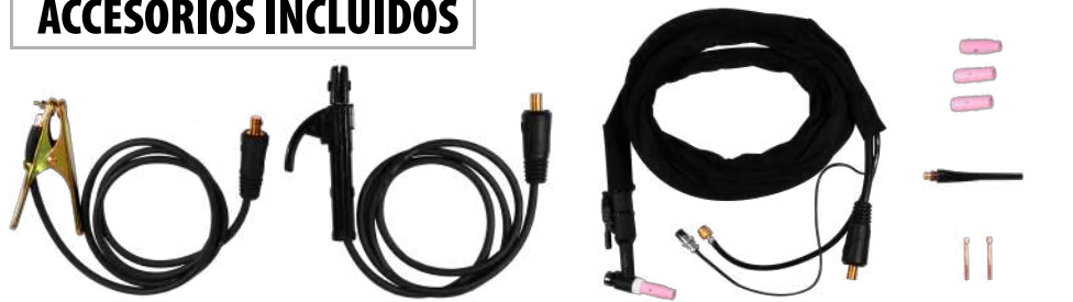
MASA + PORTAELECTRODO + ANTORCHA TIG HF + DIFUSOR + CERÁMICAS + MORDAZAS + CAPUCHON LARGO Y CORTO

Escanea el código QR para ver más información en nuestro canal corporativo.