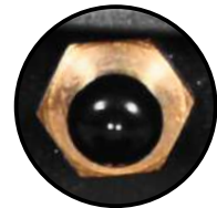
Puerto de gas inerte con control por electroválvula