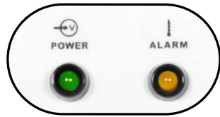
Indicadores LED de encendido y de protección térmica