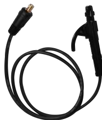
MASA + PORTAELECTRODO

Escanea el código QR para descargar el manual de usuario del equipo.