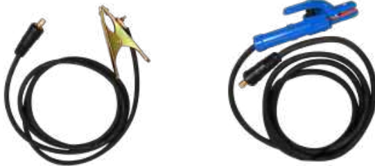
MASA + PORTAELECTRODO

Escanea el código QR para descargar el manual de usuario del equipo.