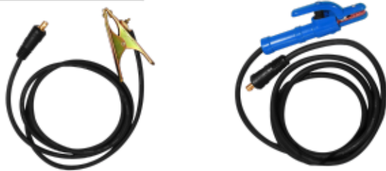
MASA + PORTAELECTRODO

Escanea el código QR para descargar el manual de usuario del equipo.