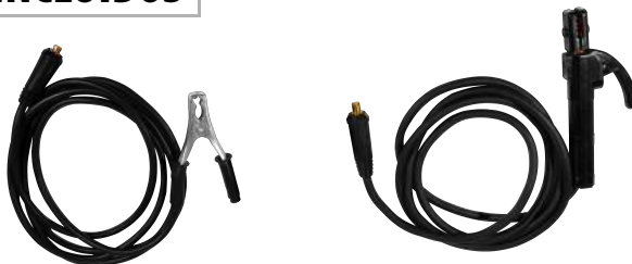
MASA + PORTAELECTRODO

Escanea el código QR para descargar el manual de usuario del equipo.