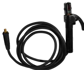
CORREA + MASA + PORTAELECTRODO

Escanea el código QR para descargar el manual de usuario del equipo.