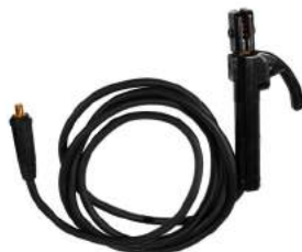
CORREA + MASA + PORTAELECTRODO

Escanea el código QR para descargar el manual de usuario del equipo.