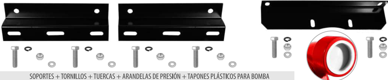
SOPORTES + TORNILLOS + TUERCAS + ARANDELAS DE PRESIÓN + TAPONES PLÁSTICOS PARA BOMBA

SOPORTE CENTRAL + TORNILLOS + TUERCAS + ARANDELAS DE PRESIÓN