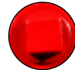
Orificio para cebado o instalación de inyector