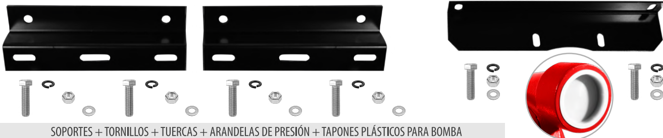
SOPORTES + TORNILLOS + TUERCAS + ARANDELAS DE PRESIÓN + TAPONES PLÁSTICOS PARA BOMBA

SOPORTE CENTRAL + TORNILLOS + TUERCAS + ARANDELAS DE PRESIÓN