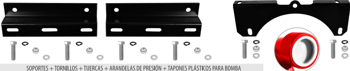
SOPORTES + TORNILLOS + TUERCAS + ARANDELAS DE PRESIÓN + TAPONES PLÁSTICOS PARA BOMBA

SOPORTE CENTRAL + TORNILLOS + TUERCAS + ARANDELAS DE PRESIÓN